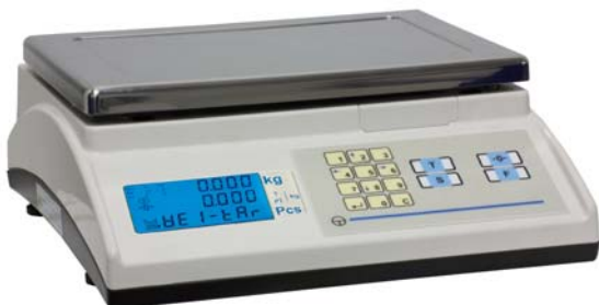
Marte 10 MF

La gama de balanzas Marte de GRUPO EPELSA está formada por una gran variedad de equipos que se muestran a continuación: