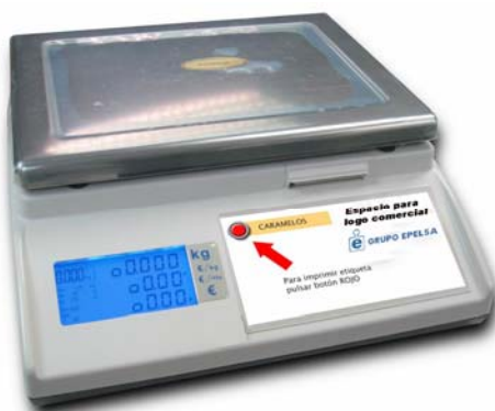
Marte ILC 1T

Balanza sobre mostrador, cuatro vendedores