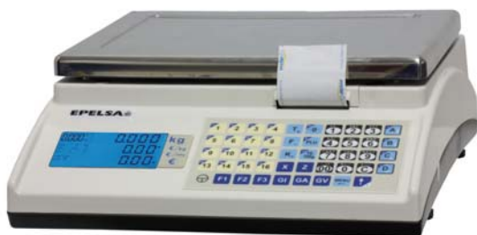
Marte 10 V4 IC

Balanza sobre mostrador, etiquetadora, especial para trabajo en self-service.