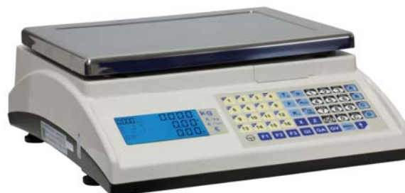
Marte 10 V4

Balanza sobre mostrador, multifunción, Peso-Tara, Niveles y Cuentapiezas