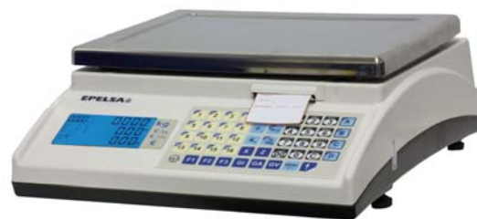
Marte 10 V4 ILC

Balanza sobre mostrador, cuatro vendedores, impresora, interconectada.